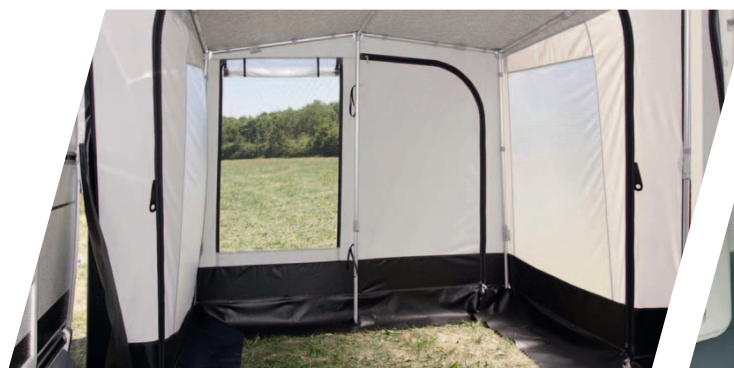
Rolli Plus Ambiente Innenansicht Anbau