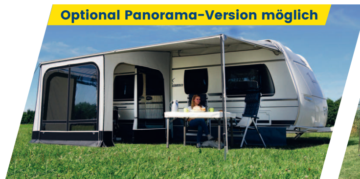
Rolli Plus Ambiente 250, Panoramafunktion