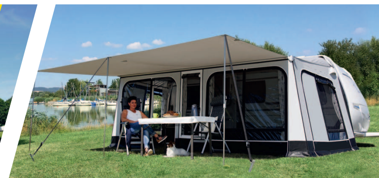
Rolli Plus Ambiente mit Sonnendach