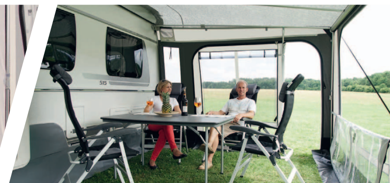
Rolli Plus Ambiente 300 Innenansicht